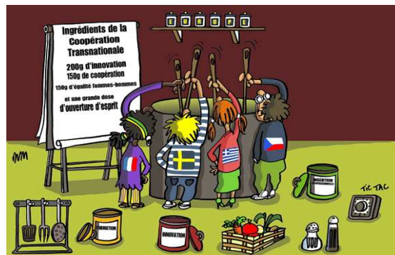
Présentation du dispositif